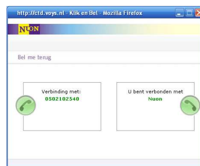
Figuur 1: Call Me Now op de website van Nuon